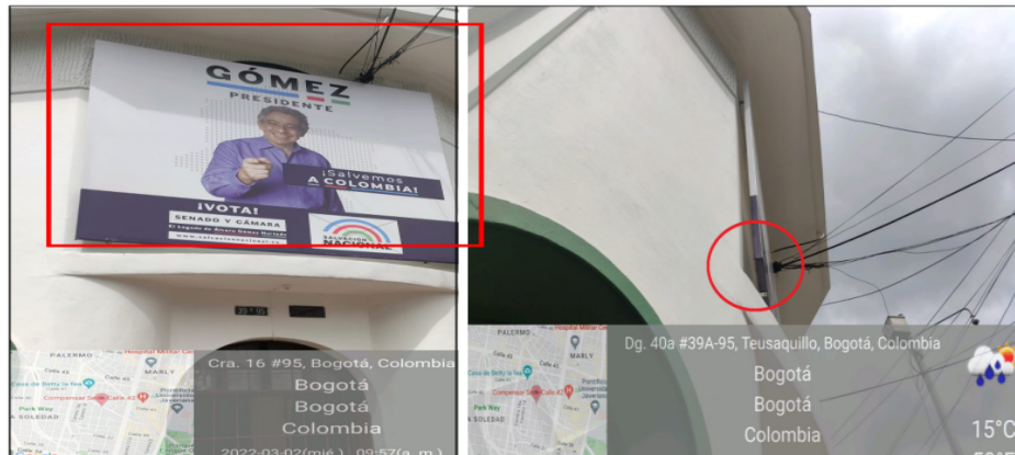
Foto No 3 Elemento publicitario con texto publicitario "GOMEZ PRESIDENTE +SALVEMOS A COLOMBIA VOTA + SENADO Y CÁMARA + EL LEGADO DE ALVARO GOMEZ HUERTADO + WWW.SALVACIONNACIONAL.COM + LOGO + SALVACION NACIONAL" el cual se encuentra cubriendo ventanas. y se encuentra violado de fachada.