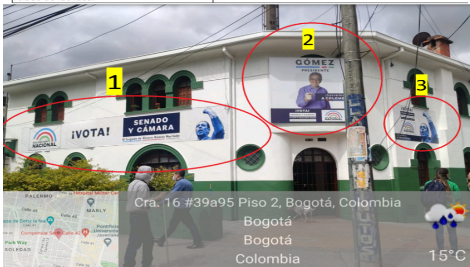
Foto No 5. Vista panorámica del predio ubicado en la dirección carrera 16 No. 39 A – 95 en la cual se pueden evidenciar tres (3) elementos publicitarios en primer lugar el aviso identificado con el numero (1) el cual se encuentra colocado con vista por la carrera y cuenta con el texto publicitario "LOGO DEL PARTIDO+SALVACION NACIONAL+VOTA + SENADO Y CAMARA +EL LEGADO DE ALVARO GOMEZ HUERTADO+ FOTO DE ALVARO GOMEZ HUERTADO", el segundo elemento identificado con el numero (2) ubicado en la entrada principal con texto publicitario "GOMEZ PRESIDENTE +SALVEMOS A COLOMBIA VOTA + SENADO Y CAMARA + EL LEGADO DE ALVARO GOMEZ HUERTADO + WWW.SALVACIONNACIONAL.COM + LOGO + SALVACION NACIONAL" el cual se encuentra volado de la fachada y cubre ventanas., y tercer elemento identificado con numero (3) el cual se encuentra ubicado con vista hacia la calle, con texto publicitario "VOTA + SENADO Y CAMARA + EL LEGADO DE ALVARO GOMEZ HUERTADO + WWW.SALVACIONNACIONAL.COM + LOGO + SALVACION NACIONAL+SALVEMOS A COLOMBIA", es de aclarar que al momento de la visita técnica los elemento tipo aviso se encontraban instalados sin contar con el registro ante la Secretaría Distrital de Ambiente.